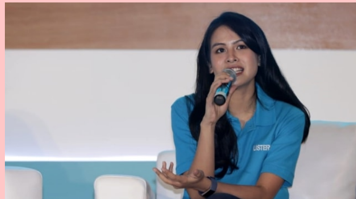
Maudy Ayunda.

Di Indonesia, banyak perempuan yang patut untuk dijadikan inspirasi terkait Hari Perempuan Internasional. Bahkan, banyak juga perempuan-perempuan luar biasa itu muncul dari kalangan selebriti. Tidak hanya berprestasi, mereka juga masih sangat muda dan memiliki paras yang rupawan