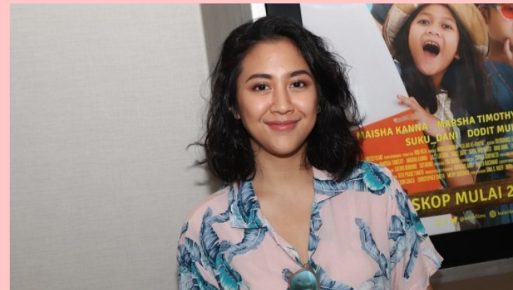
Sherina Munaf

Masih dari penyanyi tanah air, kali ini nama Sherina Munaf juga patut menjadi sosok inspiratif Hari Perempuan Internasional. Tidak hanya di bidang tarik suara, bahkan ia juga mengasah kemampuan menggambar. Tidak tanggung-tanggung, perempuan yang mulai berkarier sejak tahun 1999 itu belajar menggambar hingga ke Negeri dengan julukan Matahari Terbit, Jepang.