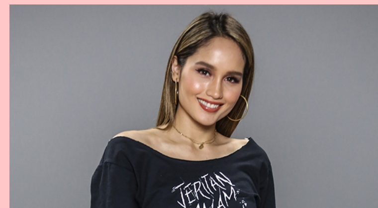
Pemain film Cinta Laura

Cinta Laura juga salah satu selebriti yang sangat peduli dengan pendidikannya. Penyanyi sekaligus aktris kelahiran Jerman 25 tahun silam ini juga memiliki prestasi yang mencolok di bidang pendidikan. Ia telah menyelesaikan pendidikan di Columbia University mengambil dua jurusan berbeda, Psikologi dan Sastra Jerman. Ia juga lulus dan menyandang peringkat Cumlaude dengan waktu tempuh pendidikan hanya tiga tahun. *Sumber : kumparan.com