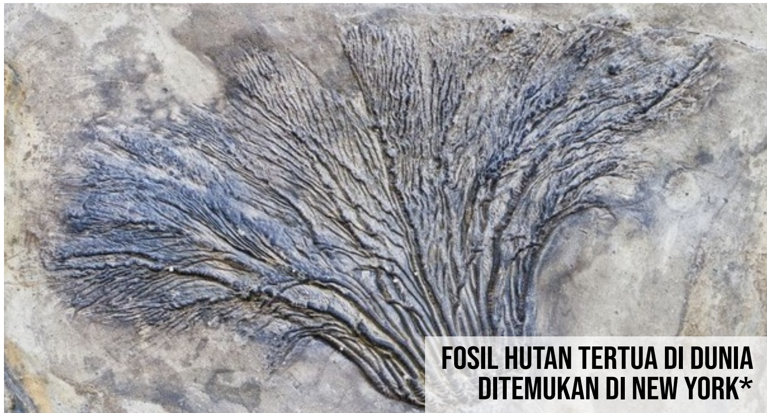
FOSIL HUTAN TERTUA DI DUNIA DITEMUKAN DI NEW YORK*